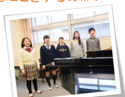
中学3年生の授業は... 7つの習熟度別クラス (高等学校音楽科1年生と合同)